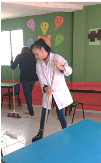
Avant le départ on range