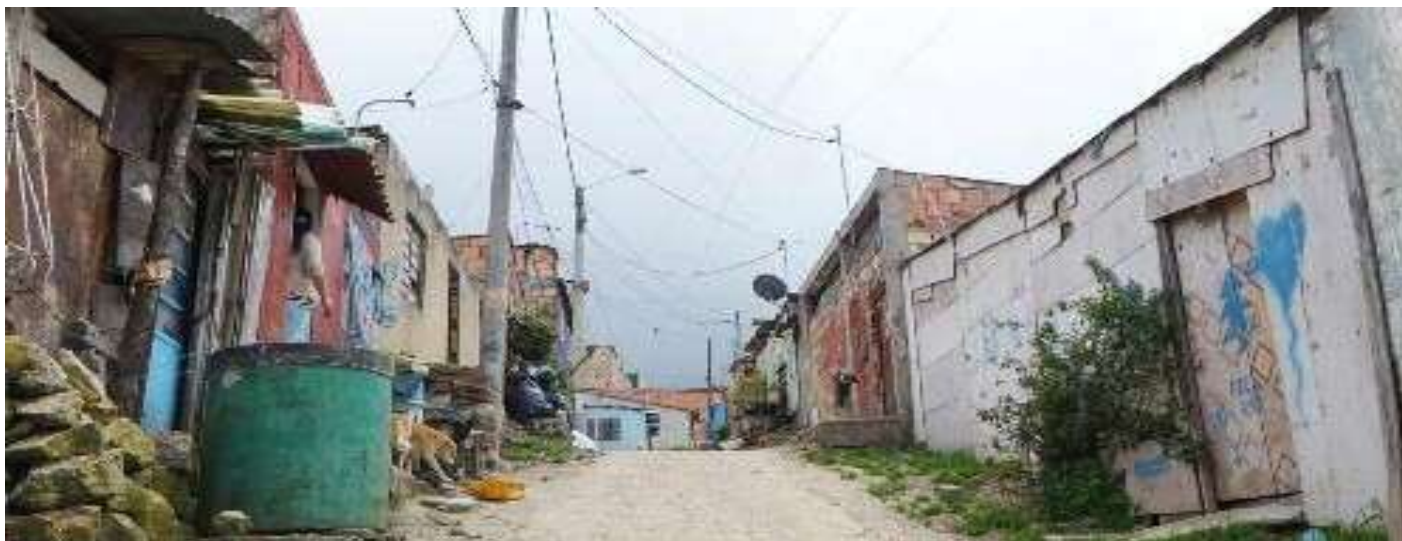
Dans le quartier de Juan Rey à Bogota.