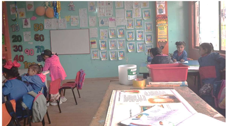
Moment studieux chez Dorelly

L'atmosphère et l'ambiance sont totalement différentes entre les centres. Chaque centre a son mode de fonctionnement, son organisation pour les courses et le quotidien, sa particularité. Chez Gléry c'est plus scolaire et axé sur le travail pour le collège. Des sorties sont organisées pour du sport dans les parcs proches du centre. Chez Martha on chante, on danse, on bouge (gymnastique) il y a une joie de vivre tout en réalisant des apprentissages et beaucoup de félicité, mais il n'y a aucun moyen de récréation dans des parcs.