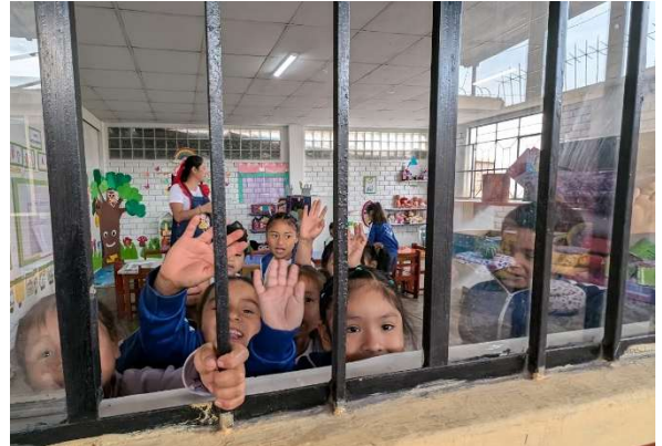
La joie des enfants de Luya à notre arrivée

L'implantation chinoise favorisée par le Gouvernement se fait également sentir sur tout le pays.