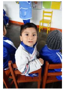
Des enfants studieux et concentrés sauf ....

Qaliwarma agréé par le Ministère, qui consiste théoriquement à compenser une certaine dénutrition chez les enfants des quartiers pauvres, est réduit à sa plus simple expression suite à la corruption de ceux qui le gèrent : ce jour, un tout petit pain auquel s'ajoute une poche plastique remplie d'un jus d'eau et de farine d'avoine beigeasse peu attrayant et que la majorité des enfants refuse d'ingurgiter ; pour des raisons soi-disant sanitaires, l'UGEL (Education Nationale) refuse qu'on y incorpore un jus de fruit qui lui donnerait du goût. Néanmoins, au moins une fois par semaine s'ajoutent une petite boîte de lait enrichi et un cake plus nutritif que les enfants apprécient.