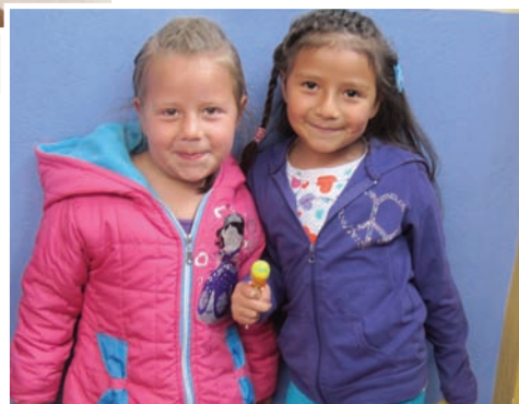
Deux « anciennes » de l'année dernière