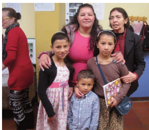
Trois générations d'enfants éduqués dans nos centres.