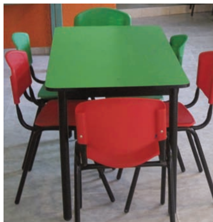
Le nouveau mobilier du centre. C'est un don de l'APAEC (association des parents adoptifs d'enfants colombiens) qui a rendu possible son achat.