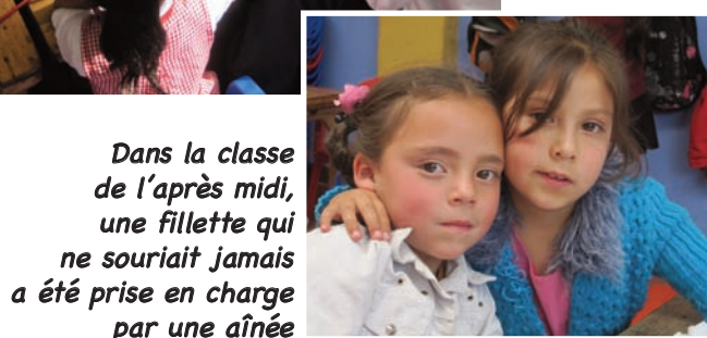
Dans la classe de l'après midi, une fillette qui ne souriait jamais a été prise en charge par une aînée