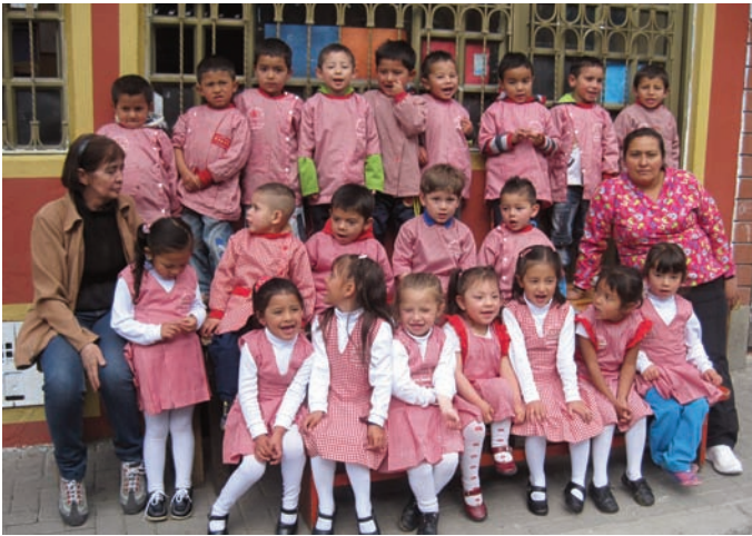
La classe du matin chez Nubia. Il y a davantage de garçons ici : 13, contre 8 filles. La classe de Nubia compte 22 inscrits.