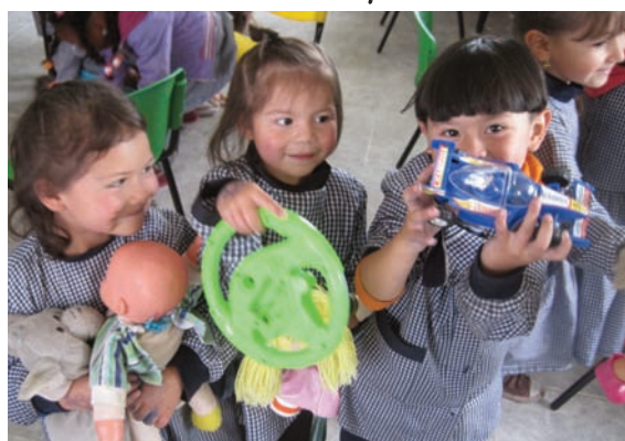
Au rayon des jouets, chacun son dû : poupées, voiture de course, volant de voiture...