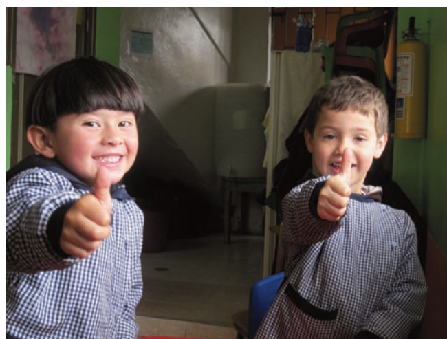
Et nous, nous gagnerons !