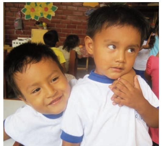
Deux frères qui s'aiment bien.