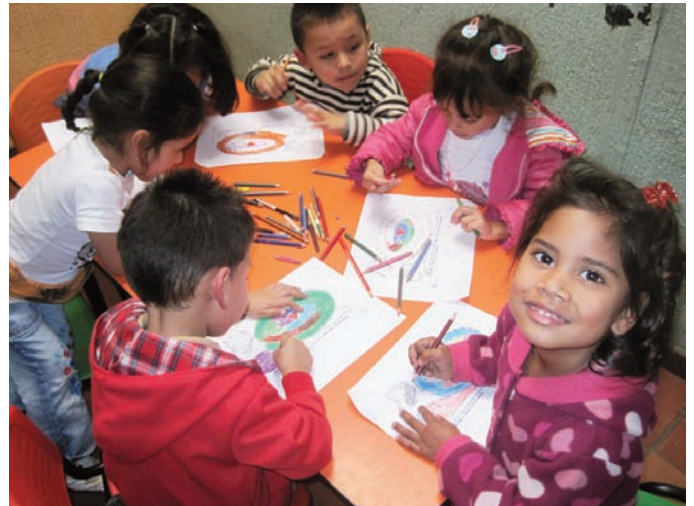
Très apprécié : le moment du coloriage après le petit déjeuner.