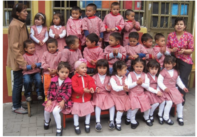
Chez Yelitza, le matin, il y a aussi un peu plus de garçons... L'effectif est au complet avec 21 présents.