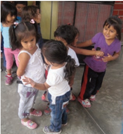
Une discussion sérieuse entre deux fillettes lors de la sortie en récréation. Il faut savoir qu'une programmation très stricte organise la matinée des centres.

Il sera question de cette demande dans toutes nos réunions à venir. Nos adhérents en seront bien sûr informés. ■