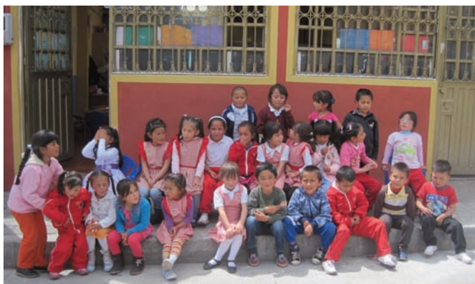
La classe de l'après midi. Elle a 25 inscrits. Il s'agit d'enfants qui étaient au centre l'année précédente et sont donc plus âgés ou qui, de façon générale, ont besoin d'un soutien scolaire.