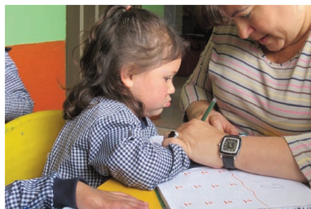
Cette fillette avait de grandes difficultés à écrire les lettres ; mais tout le reste, elle le faisait très bien...