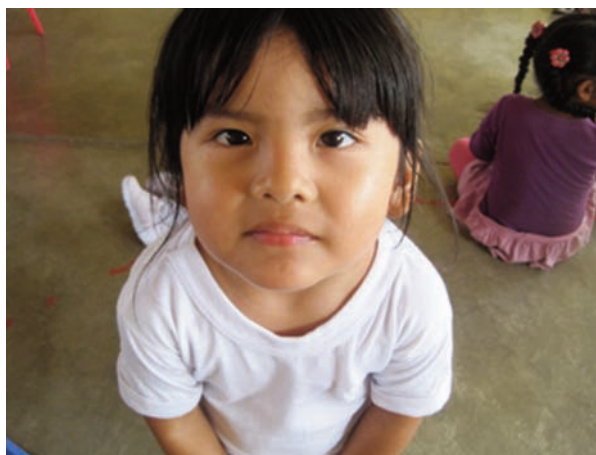
Deux enfants de La Libertad, le quartier le plus misérable de tous ceux que nous connaissons à Lima. Ce petit garçon était le plus vif de toute la bande - souvent insupportable. Et cette petite fille ne cessait pas de nous regarder depuis notre arrivée.