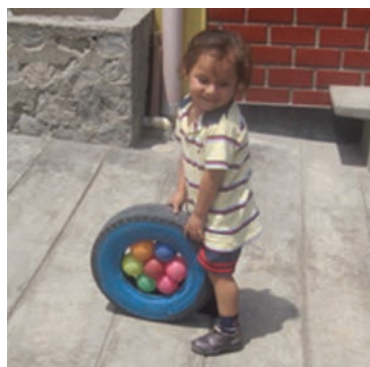
Les jeu des ballons a été curieusement amélioré par l'idée qu'a eue cette gamine de bloquer des balles de plastique à l'intérieur.