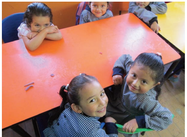
Elles n'ont pas l'air malheureux, nos petites amies. C'est l'une d'elles qui a demandé au « francès » : « Pourquoi tu es ici ? »