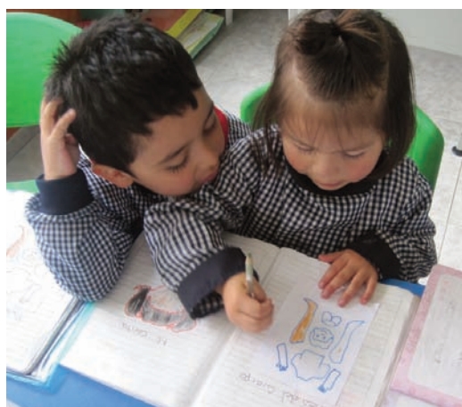
Il s'agissait de colorier les parties du corps humain. Il y avait celle qui savait, et celui qui voulait savoir comment le faire bien.