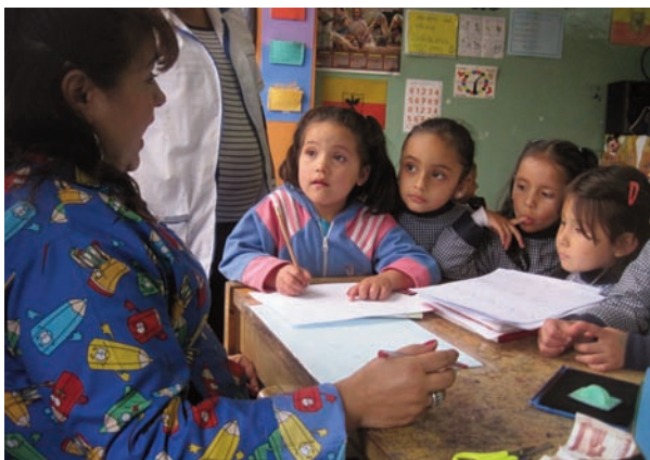
Sans doute, B et A, cela fait BA... Encore faut-il l'apprendre.