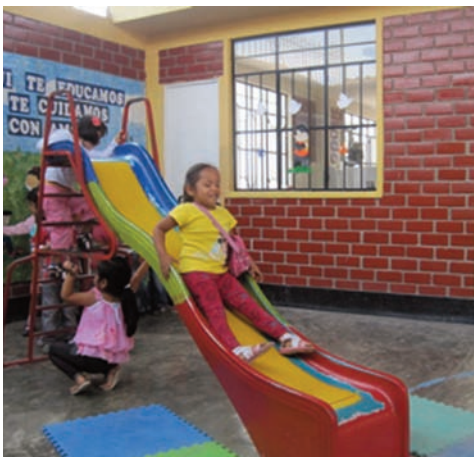
Les toboggans sont toujours très appréciés.