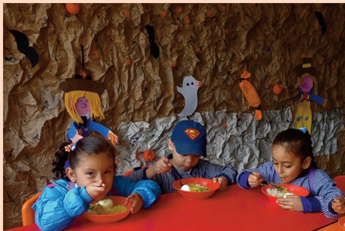
El Rocio aux couleurs d'Halloween.

Comme chaque année depuis bien longtemps, nous aiderons quelques enfants parmi les plus défavorisés à entrer à l'école primaire en leur payant l'uniforme obligatoire : 4 à Cazuca, 2 à Santa Librada, 6 à Juan Rey. J'ai visité la plupart des familles à aider et, à chaque fois, c'est un crève-cœur de découvrir dans quelles conditions ces enfants vivent. Bien des familles n'ont ni l'électricité, ni l'eau courante. On peut se demander comment les enfants peuvent arriver si pimpants aux centres. ■