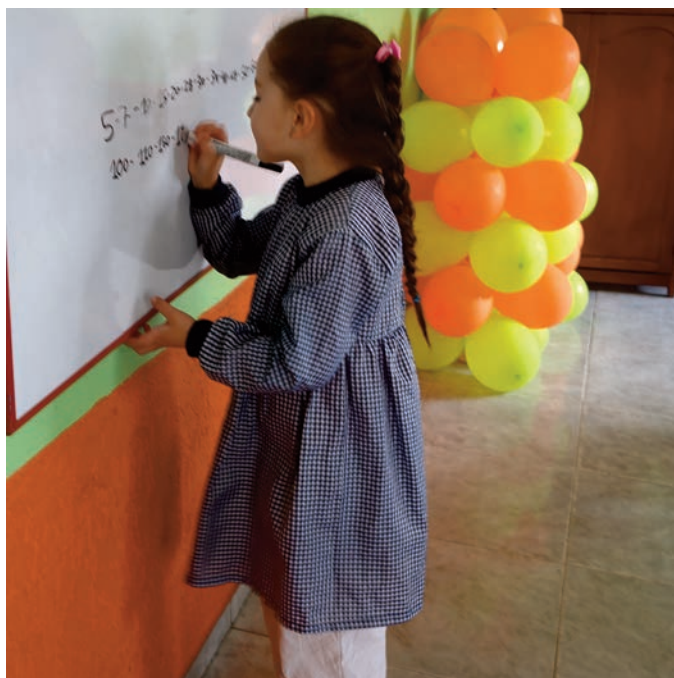
Elle sait bien écrire les chiffres, cette élève de Lucero.

Lucero, suivant en cela les directives de l'Education