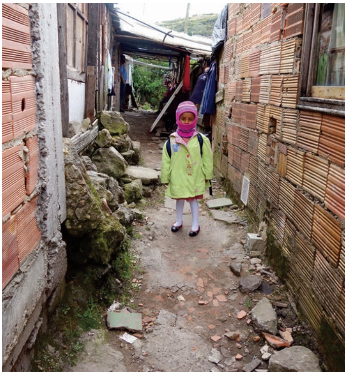
Dans les rues et venelles de Juan Rey