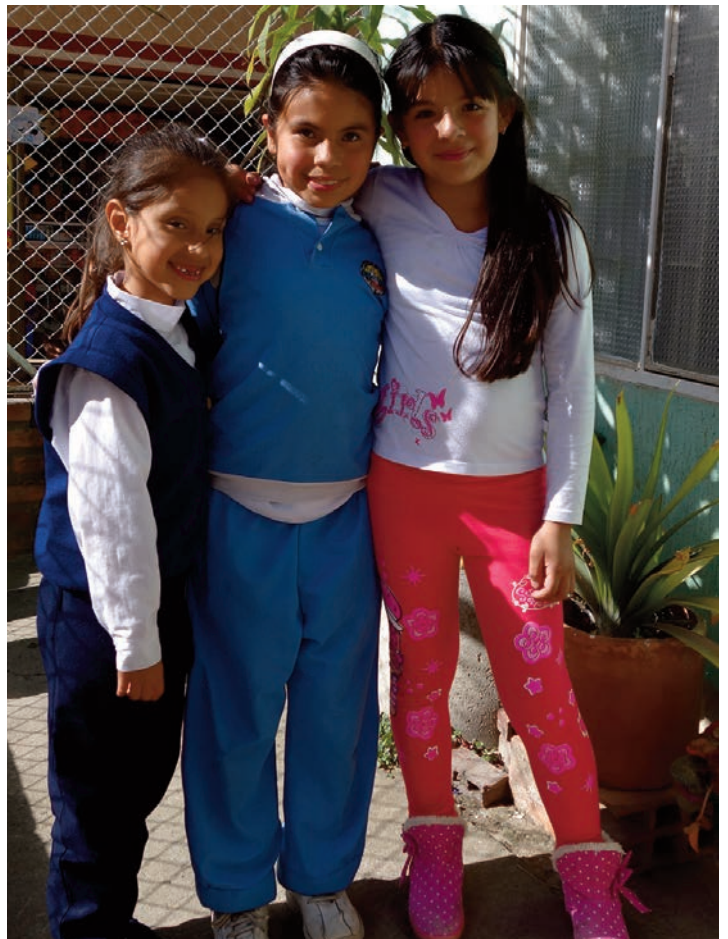
Trois anciennes élèves qui reviennent l'après midi pour travailler et regarder des livres.