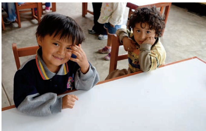
Deux enfants de Niños del Mañana.