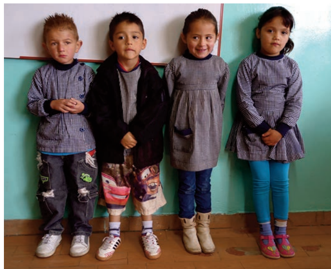
Quatre élèves de Dorelly que nous allons aider pour leur entrée à l'école primaire.