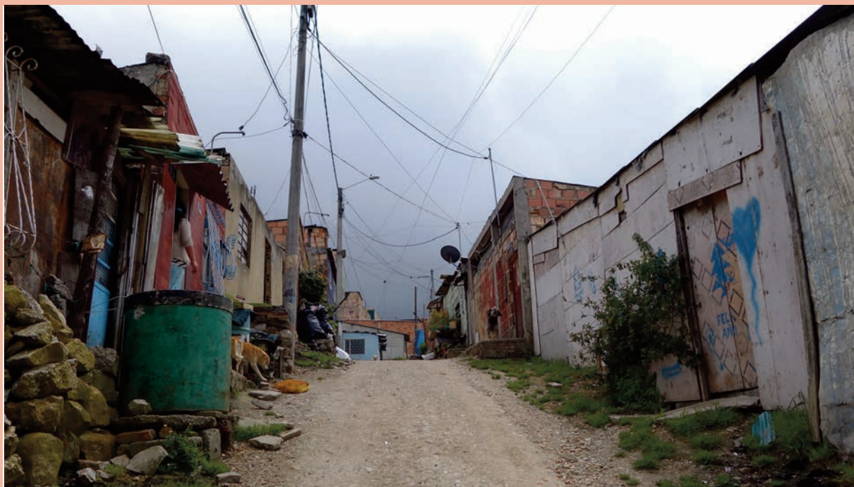
Dans cet environnement si difficile, les centres de Glery sont une lueur d'espoir pour les familles de Juan Rey.