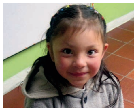
Parmi les élèves du matin : l'effrontée, la mélancolique, la toute gentille