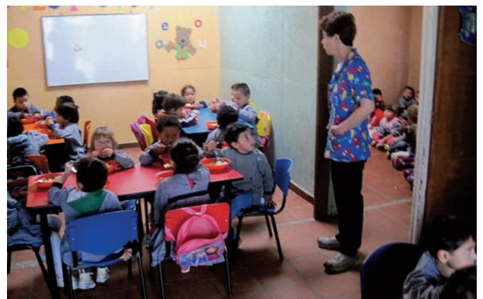
Le déjeuner des enfants de El Rocio. On aperçoit les enfants de Camino Viejo relégués dans la petite pièce.

leur raconte ou lit une histoire. Le repas terminé, les enfants remontent dans leur grande salle attendre ceux qui viennent les rechercher ; et ceux de Camino Viejo se mettent à table.