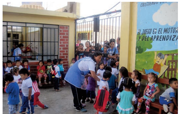
Après le déjeuner, parents et enfants s'attendent les uns les autres. La dispersion prend une bonne heure au cours de laquelle des profesoras occupent les enfants encore présents.