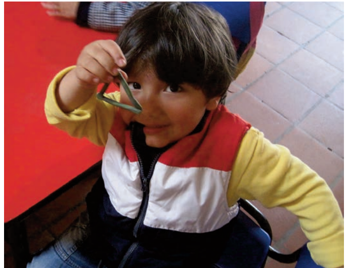
Comment apprendre la géométrie avec de la plastiline.