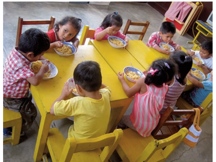
Ces enfants ont battu des mains quand ils ont su qu'ils auraient des tallarines (pâtes avec viande hachée et sauce tomate) pour déjeuner.

Ils vont bien, nos trois centres dans les sables. Moins pour la prospérité des familles, certes (rien ne bouge dans ce secteur) que dans la manière dont ils sont menés. Quant aux problèmes de sécurité... Sachons seulement que quelques journaux parmi les plus sérieux ont commencé à parler de la « mexicanisation » du Pérou. Un terme sûrement excessif mais qui indique bien la tendance.