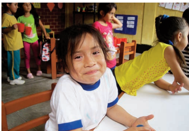
Lima, centre Niños del Mañana.