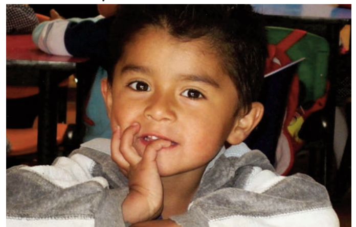
Un jeune garçon pensif à Camino Viejo.