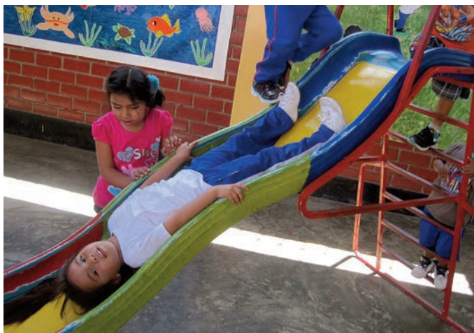
Du bon usage du toboggan...