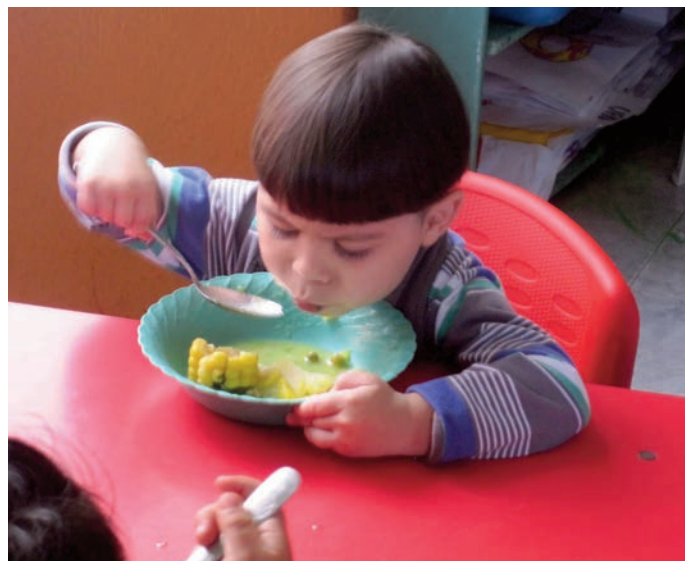
Le plus petit de la classe. Il ne voulait se plier à rien... sauf à l'heure du déjeuner.