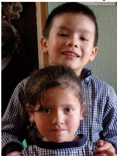
Deux bons amis aux « Pequeños Traviesos ».