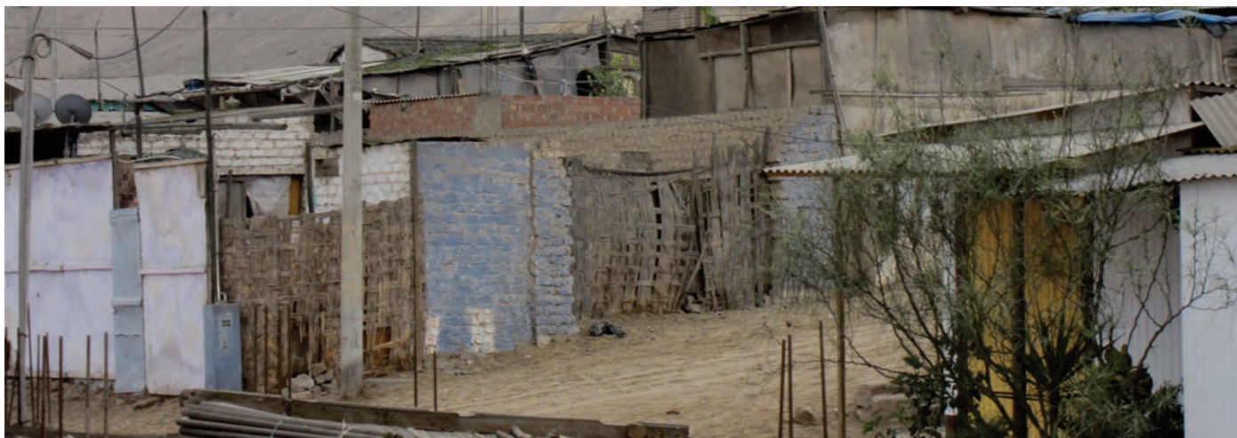
Dans le quartier de La Libertad, tout près du centre financé par Terre de Partage et Pour Qu'ils Vivent.