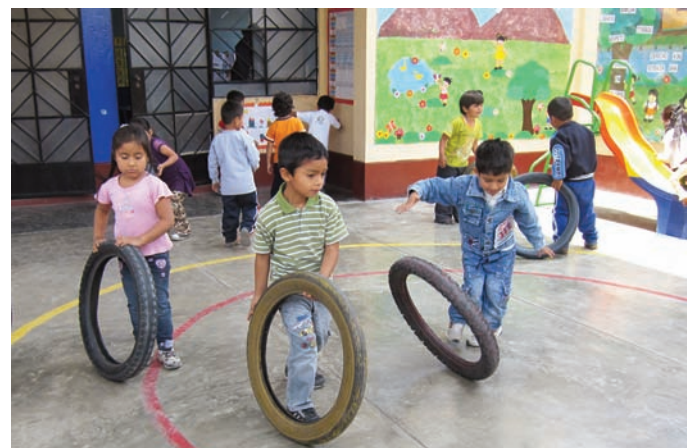
Les pneus usagés des motos taxis ; un jeu dont on ne se lasse pas.

D'une manière générale, les enfants sont assez agités, nettement plus qu'en Colombie, et tiennent peu en place ; j'admire les professeurs qui arrivent à capter leur attention plus de cinq minutes. D'autre part, on note un absentéisme plus important qu'en Colombie, en particulier à Luya où les enfants présents dépassent rarement la cinquantaine. ■