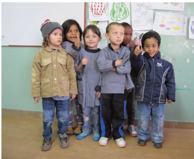
Six enfants des centres de Cazuca : une grande diversité dans les couleurs de peau, d'yeux et de cheveux.

D ans ce quartier, le plus défavorisé que je connaisse, vit une population le plus souvent déplacée à cause de la guérilla, des paramilitaires ou des narco-traficants. Nos centres y accueillent plus de 90 enfants dans deux locaux voisins : deux séries le matin et une l'après-midi. Il n'existe plus aucune autre structure d'accueil dans ce quartier, à l'exception d'une petite ONG qui sert un repas aux enfants du Primaire et Secondaire après leur longue route à pied : ils reviennent d'un collège situé de l'autre côté de la montagne qui surplombe et menace Cazuca. C'est tout naturellement à Cazuca que l'on rencontre le plus d'enfants aux histoires terribles. Curieusement cette année, et contrairement à l'habitude, plusieurs