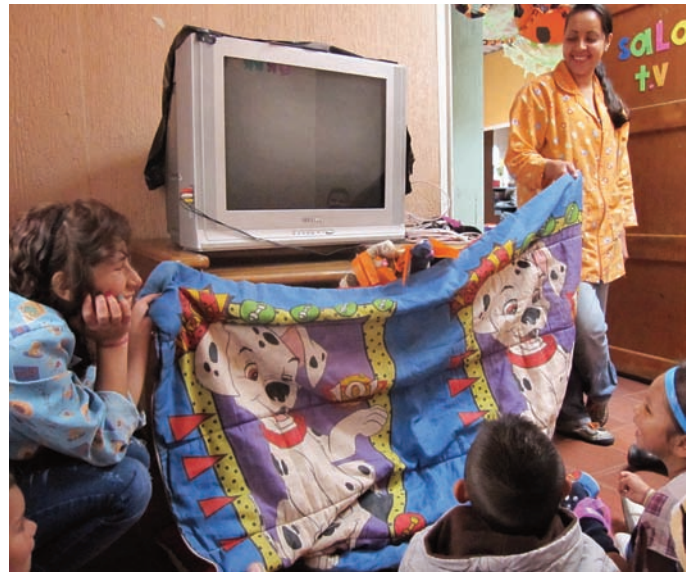
Los Pequeños traviosos apprécient beaucoup ce petit spectacle de marionnettes improvisé.

A Santa Librada , quartier de La Paz (la paix, nom peu approprié), se trouve le centre Teresa Riotto (financé par ENT-Lyon). On note peu de changement à l'exception de la peinture des murs. Lucero est