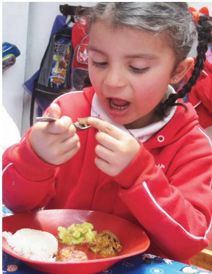
L'alimentation est meilleure... mais il faut bien considérer ce que l'on va manger !