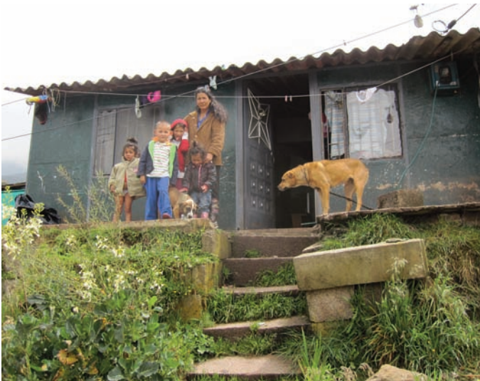
Une famille de San Pedro dont nous avons 2 enfants aux centres.

La fête s'est poursuivie le lundi car la Municipalité de Juan Rey avait programmé une semaine de fête de la culture indigène. Il était prévu que les jardins d'enfants défilent dans les rues, plus ou moins déguisés en indigènes. Cela m'a donné l'occasion de visiter un jardin d'enfants de l'Intégration Sociale. S'il était bien propre et bien carrelé, il ne répondait pas vraiment aux normes que cette ad-