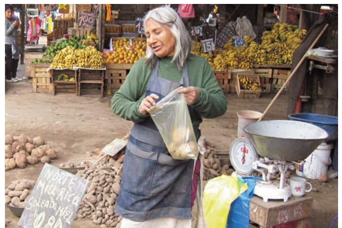
Au marché de Puente Piedra. L'alimentation de nos centres coûte beaucoup plus cher, l'aide gouvernementale n'ayant pas encore été rétablie.

national péruvien, des « anticuchos » (brochettes de cœur de vache) accompagnés de diverses sauces piquantes, et en dessert les fameux « picarones » de Valeria, la cuisinière de Micaela, le tout arrosé de « chicha morada », une boisson à base de maïs et de cannelle. Ce repas avait aussi pour but de marquer mon départ en présence de toutes les professeures et cuisinières. ■