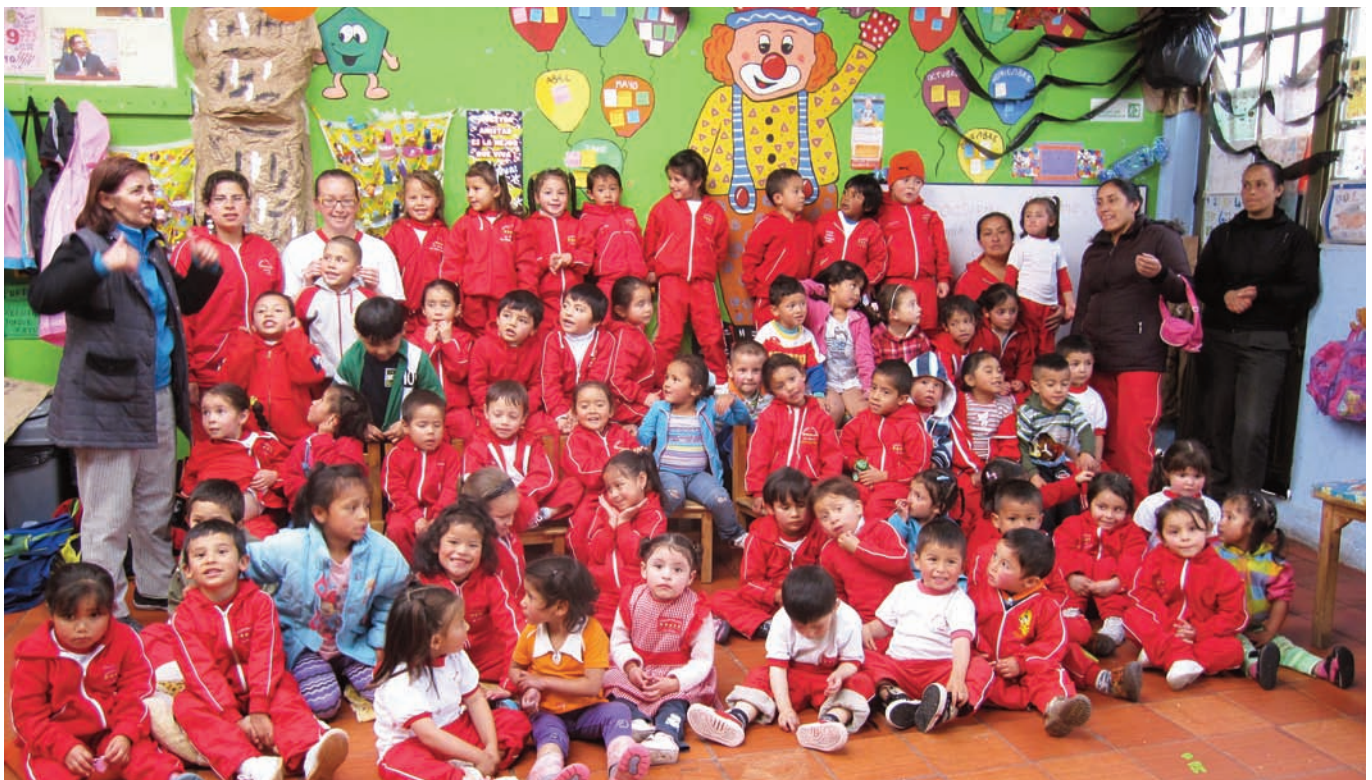
Les enfants des trois centres de l'après midi à Juan Rey, avec leurs responsables.