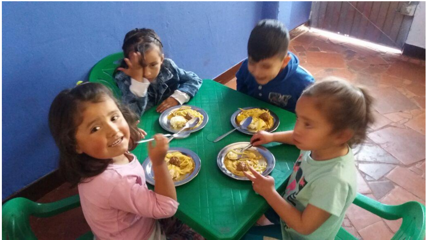
Dans la classe de Nubia, à l'heure du déjeuner...