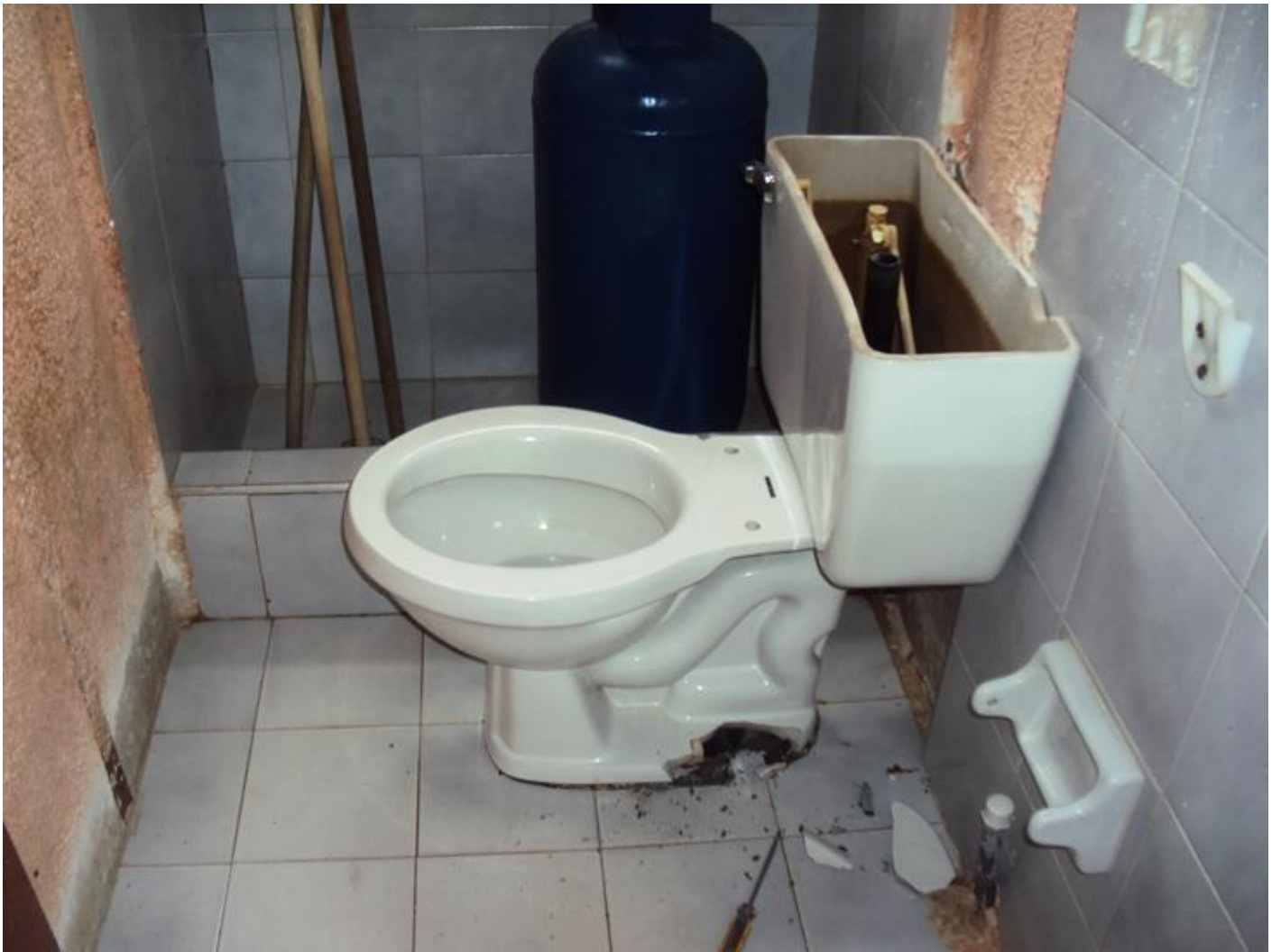
Les WC avant....