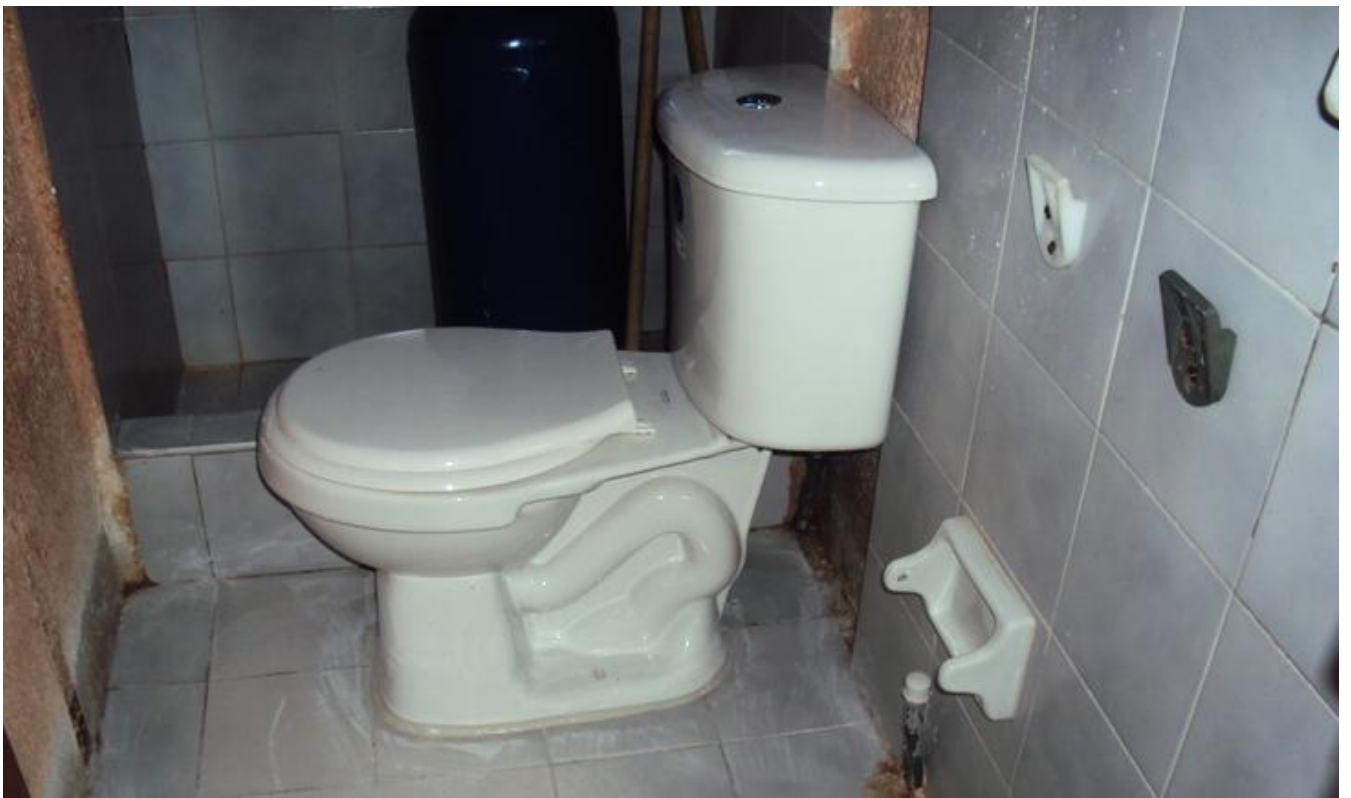
.... Et après financement par l'Apac